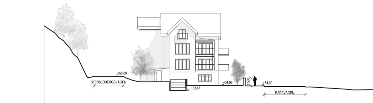
Illustrationskiss fasad mot väster