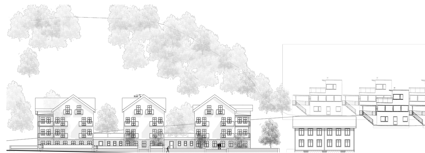
Illustrationskiss fasad mot söder