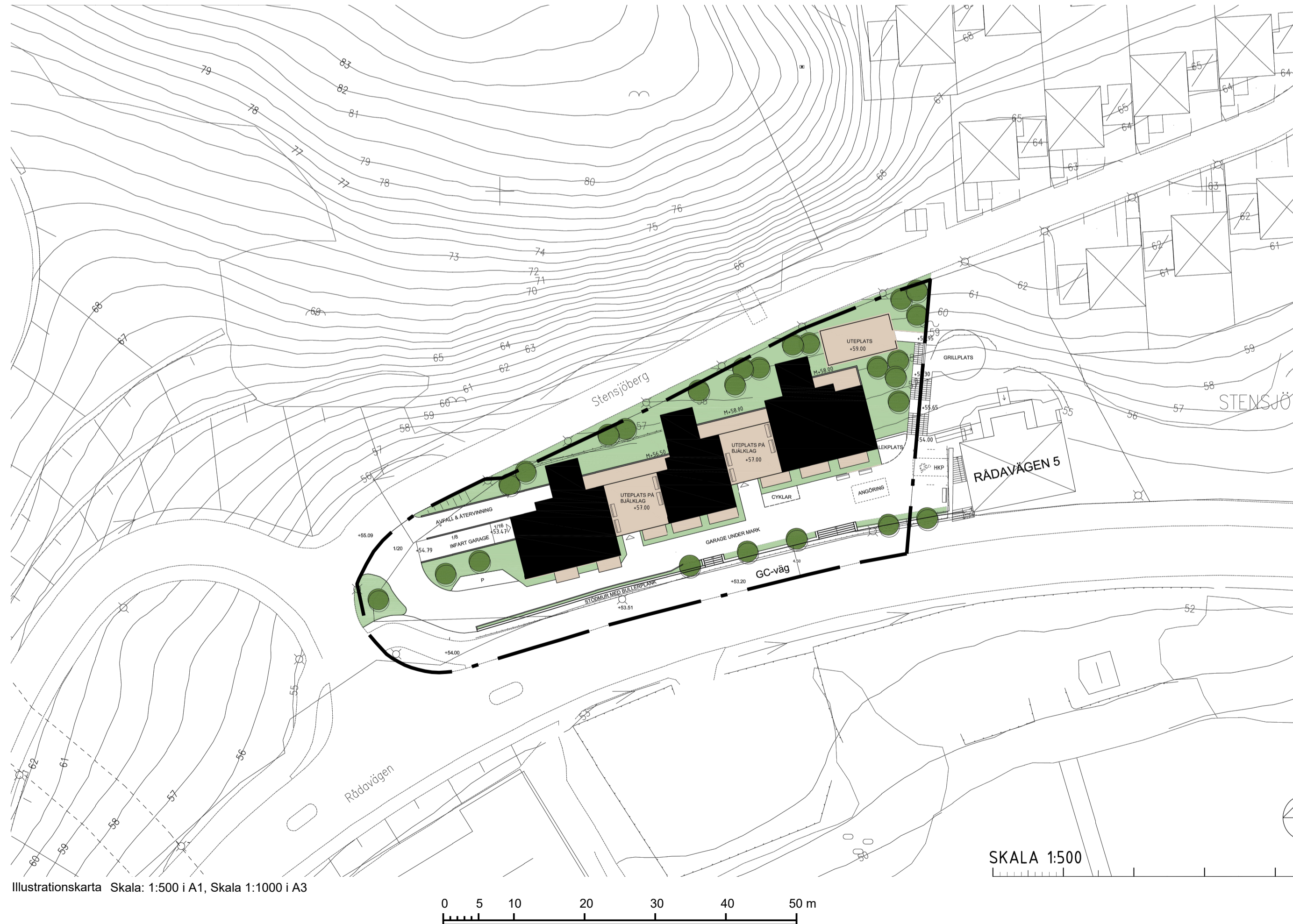
Illustrationskarta Skala: 1:500 i A1, Skala 1:1000 i A3