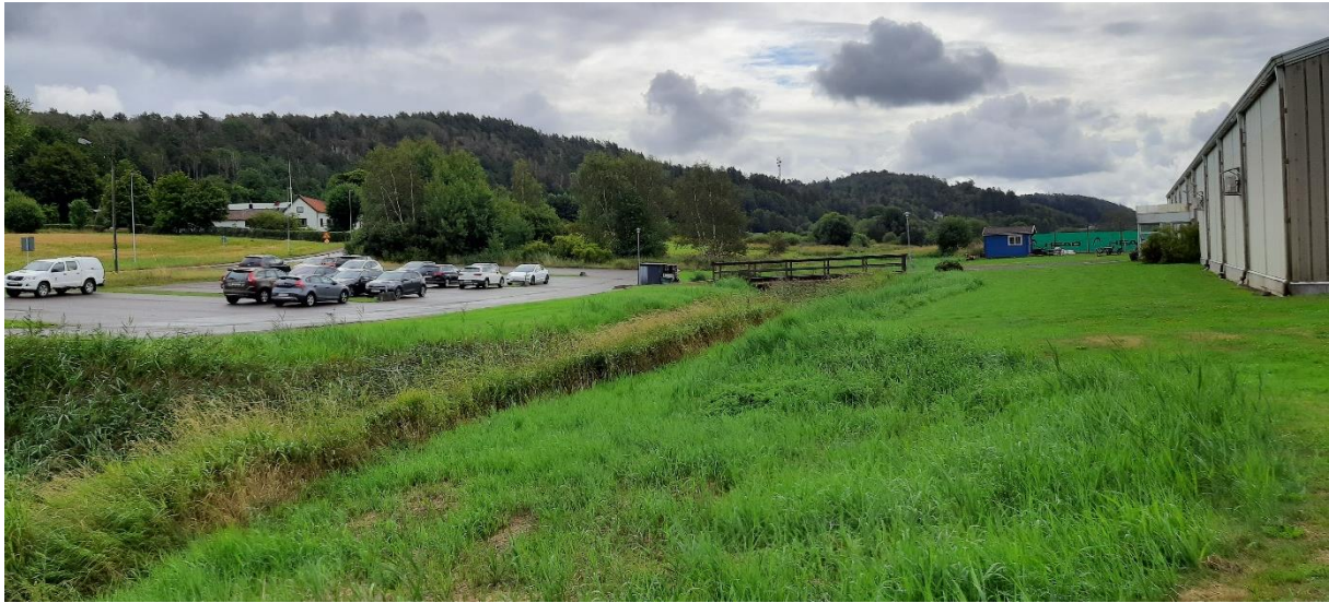
Foto taget från gång- och cykelvägen i planens norra del med vy mot söder.