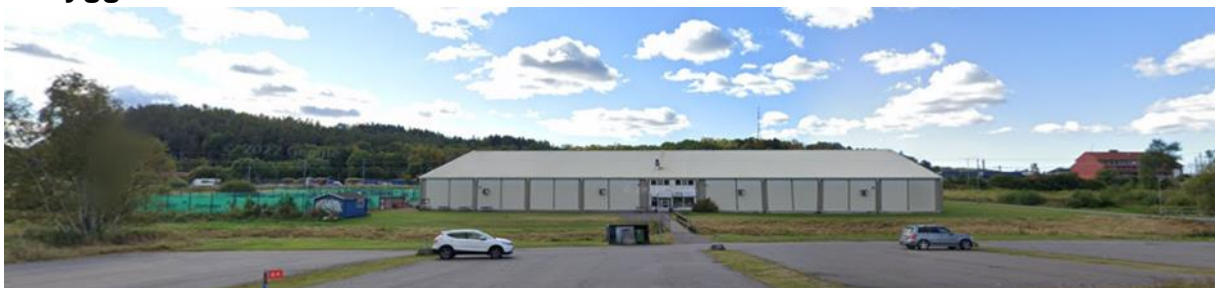
Foto över tennishallen med dess utomhusbanor till vänster i bild och parkering från Kungsbackavägen.

Planområdet är bebyggt med tennishall och förrådsbyggnad. Utöver det är marken anlagd med tennisbanor utomhus och parkering.