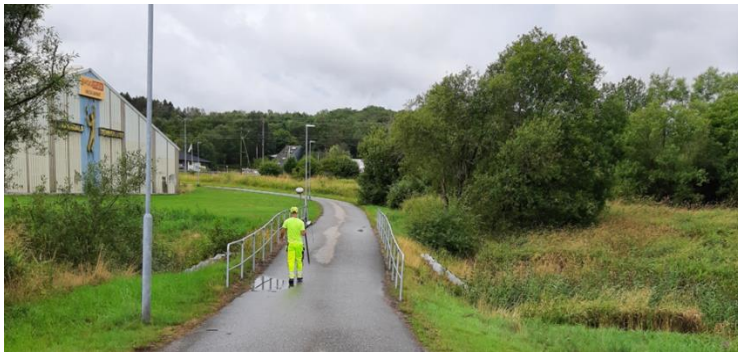
Gång- och cykelvägbro över Källeredsbäcken strax norr om tennishallen.

Kungsbackavägen ligger i närheten av planområdet som upphävs. Inom planen som upphävs finns en parkering för tennishallen i anslutning till Kungsbackavägen.