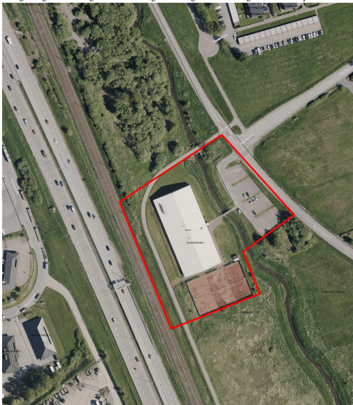
Ortofoto med gräns för upphävd detaljplan inritad i rött

Planområdet som upphävs omfattar drygt 1,5 hektar. Fastigheterna ägs av Mölndals stad. Fastighetsägare och rättighetshavare framgår av fastighetsförteckningen som tillhör planen.